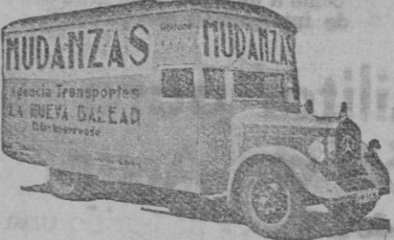
Embalajes de muebles. Guarda muebles económico. 7 Esquinas 13 Teléfono núm. 2227.

y servicio combinado con "VELOX", de Barcelona Transportes Reunidos