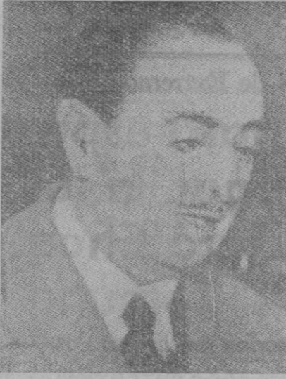
El Sr. Lequerica Para el adelantamiento de los precios

Lequerica, una vez más, urgió el inmediato cumplimiento del pacto Jordana-Berard.