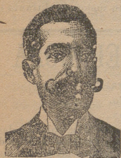
Inventor de los renombrados medicamentos COSTANZI Diputación, 435, Barna.

En Avila: En todas las buenas Perfumerías, Droguerías y Farmacias.