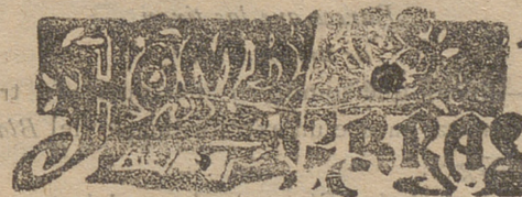
ROUGET DE LISLE

Continúa preocupando en Madrid la epidemia del tífus, que lejos de desaparecer, parece tiende á aumentarse.