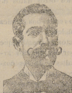
Inventor de los renombrados medicamentos

ROOB ANTISIFILITICO INYECCION VEGETAL COSTANZI