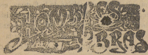
ESPOZ Y MINA

El que con sobrados motivos tiene la Historia por el más grande guerrillero de cuantos vertieron su sangre en la epopeya que llevó á cabo nuestro pueblo á principios del siglo XIX, por ser más incansable, diligente, astuto, estratégico y valeroso que «El Empecinado», Julian Sánchez Zurbarán y Palarea, aquel que hizo exclamar á Zumalacárregui en momento histórico: «Solo él podía balancear sobre los bordes del abismo el trono vacilante...», reconociendo con ello la superioridad del jefe enemigo, á pesar de ser él uno de los más grandes genios guerreros del siglo en que vivió; aquél, en fin, que por sus talentos, energías y patriotismo, de