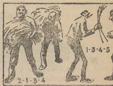
La solución en el próximo número.

Se alquila una casa en la Plazuela de la Feria, de nueva construcción, con habitaciones en la planta baja, á propósito de ejercer en ella la industria de expender al público comidas y bebidas; cuadra, corral de 381 metros cuadrados; en el principal pueden vivir cómodamente dos familias. Para tratar con su dueño, en la misma Plazuela, número 14.