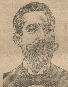
A. SALVATI COSTANZI Diputación, 435, Barc.

La grandiosa baratura con que vende esta casa sus ricos artículos apesar de su fantasia y buena calidad, ha hecho que sus ventas aumenten considera-