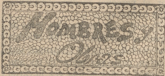
JUAN DE HERRERA

Los Ayuntamientos que opten por arrendar dicho impuesto desde 1.º de Julio próximo, lo verificarán, previa aprobación de la Administración, en las condiciones reglamentarias, por años naturales, hasta completar el máximo que conceden las disposiciones vigentes, adicionando al periodo del contrato el segundo semestre de 1900.»