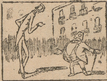
La solución en el próximo número.