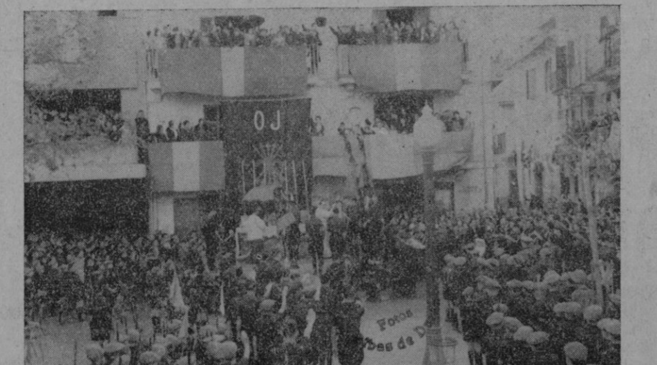
Un aspecto de la plaza de España de Inca, mientras se celebraba la misa de campaña.