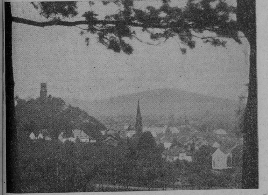
Waldesberg, la pintoresca villa alemana inmediata a Colonia, situada a orillas del Rin, cuyo histórico castillo será hoy escenario de la sensacional entrevista que mantendrán el Führer Hitler y Neville Chamberlain