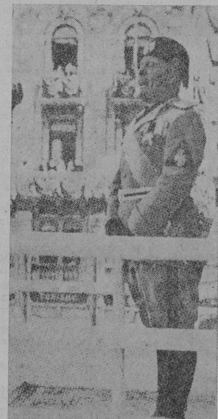
Trieste. — El Duce pronunciando su resonante discurso en la plaza triestina de la Unidad.

anuda hasta las últimas migajas de este pastel, hasta el punto de que el Ministro de Estado húngaro reclama su millón de húngaros y Polonia no se queda atrás haciendo lo mismo. Los eslovacos también lanzan un grito y se quejaron en estas circunstancias del magnífico pastel de Checoslovaquia? Podemos afirmar, sin temor a equivocarnos, que solo quedarán los huesos y éstos quizá