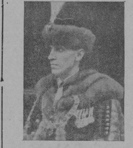
Bela de Imredy, Jefe del Gobierno de Hungría

Le acompañará en el viaje el Ministro de Negocios Extranjeros