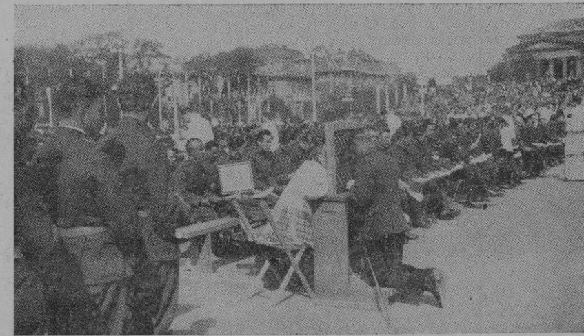
DEL CONGRESO EUCARISTICO INTERNACIONAL DE BUDAPEST La confesión, al aire libre, de los soldados de la guarnición.

ACTIVIDAD DE LA AVIACION. — Ayer fué bombardeado, con éxito, el aeródromo de Figueras. Salamanca, 8 de Julio de 1938 - II Año Triunfal. De orden de S. E., el General Jefe de Estado Mayor, Francisco Martín Moreno