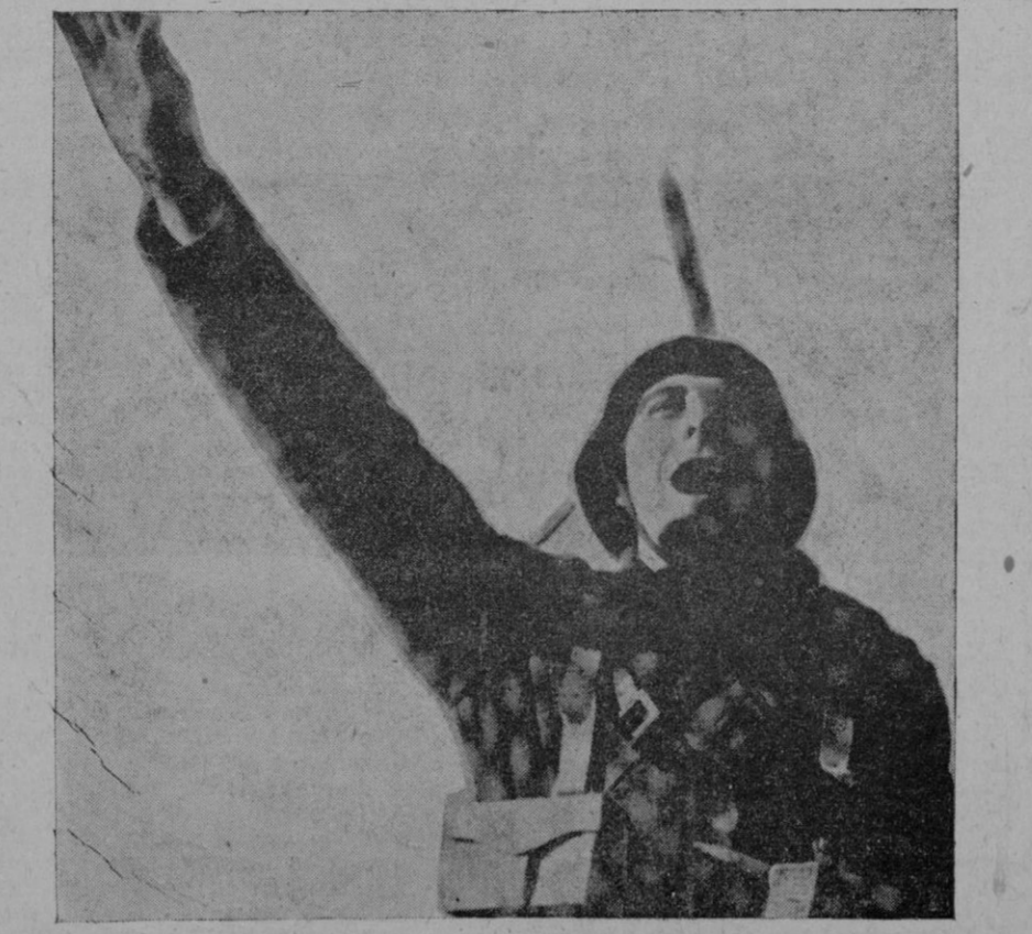
BRAZO EN ALTO, EL HEROICO SOLDADO DE LA VERDADERA ESPAÑA VITOREA A LA PATRIA Y AL CAUDILLO, QUE LE LLEVA DE VICTORIA EN VICTORIA