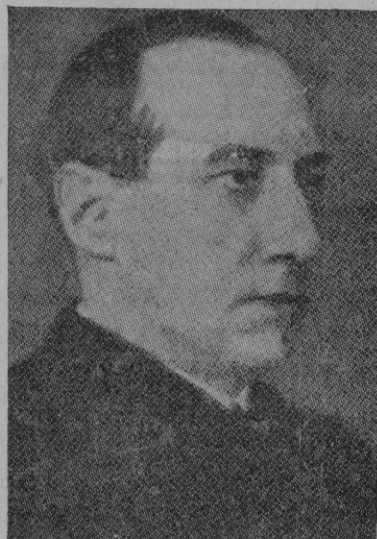
El Ministro de Negocios Extranjeros polaco, Coronel Beck

una nota energética y categorica al Gobierno lituano, en que pide inmediatas relaciones diplomáticas con la vecina república, con amenazas concretas caso de no acceder a ello, y sin excluirse el recurso a la fuerza.