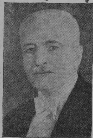
El Presidente de la República de Polonia, Ignacy Moscicki

titudinó lituana que señala a Vilna como capital de Lituania, siendo así que pertenece actualmente a Polonia; Y, finalmente, satisfacción adecuada, de parte de Lituania, por los incidentes fronterizos últimamente ocurridos.