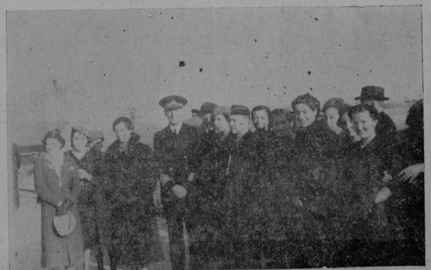
Grupo de señoritas con el Comandante de uno de nuestros gloriosos cruceros y con el Jefe Provincial de F. E. T. y de las JONS al entregar los obsequios.