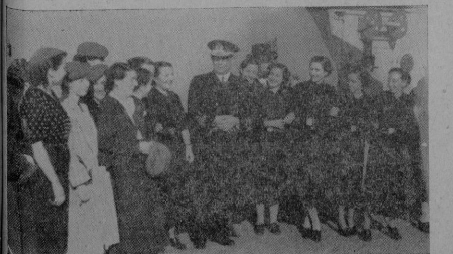
Grupo de señoritas de Frentes y Hospitales que el día de Navidad fueron a bordo de nuestros gloriosos buques de guerra para entregar obsequios a los marinos.

Luego, la suave melodía litúrgica llega a mi oído y es el cantar sonoro de voces varoniles y el arpeggiar juguetón del órgano con trinos de