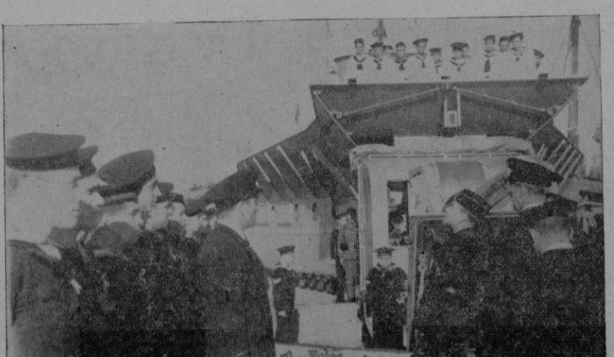
El Marqués de Zayas en el momento de entregar los obsequios a los marinos.