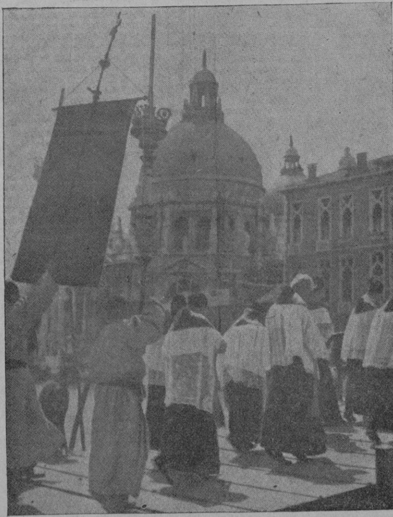
La tradicional procesión de Nuestra Señora de la Salud, que se ha celebrado una vez más, hace algunos días, en la bella ciudad de Venecia. Al fondo, la cúpula de la hermosa iglesia de la "Salute"

ción china hambrienta que regresa a Shanghai después de su ocupación por las tropas japonesas.