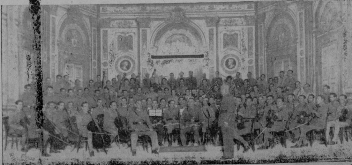
La Banda-Orquesta del Regimiento de Palma, que ha de dar esta tarde un concierto en el Principal

La Confederación Española de Cajas de Ahorro Benéficas como solemnización colectiva del "Día del Ahorro" del corriente año acordó entregar, en nombre de todas ellas, a la Excmo. Sra. doña Carmen Polo de Franco, la suma de 50.000 ptas. para la obra de la "Lectura del Soldado", que preside tan ilustre dama. La Caja de Ahorros y Monte de Piedad de las Baleares, con gran complacencia, ha remitido ya a dicha Confederación y al indicado patriótico fin la cantidad de mil quinientas ptas. con que, en virtud de la proporción, establecida, le ha correspondido contribuir.