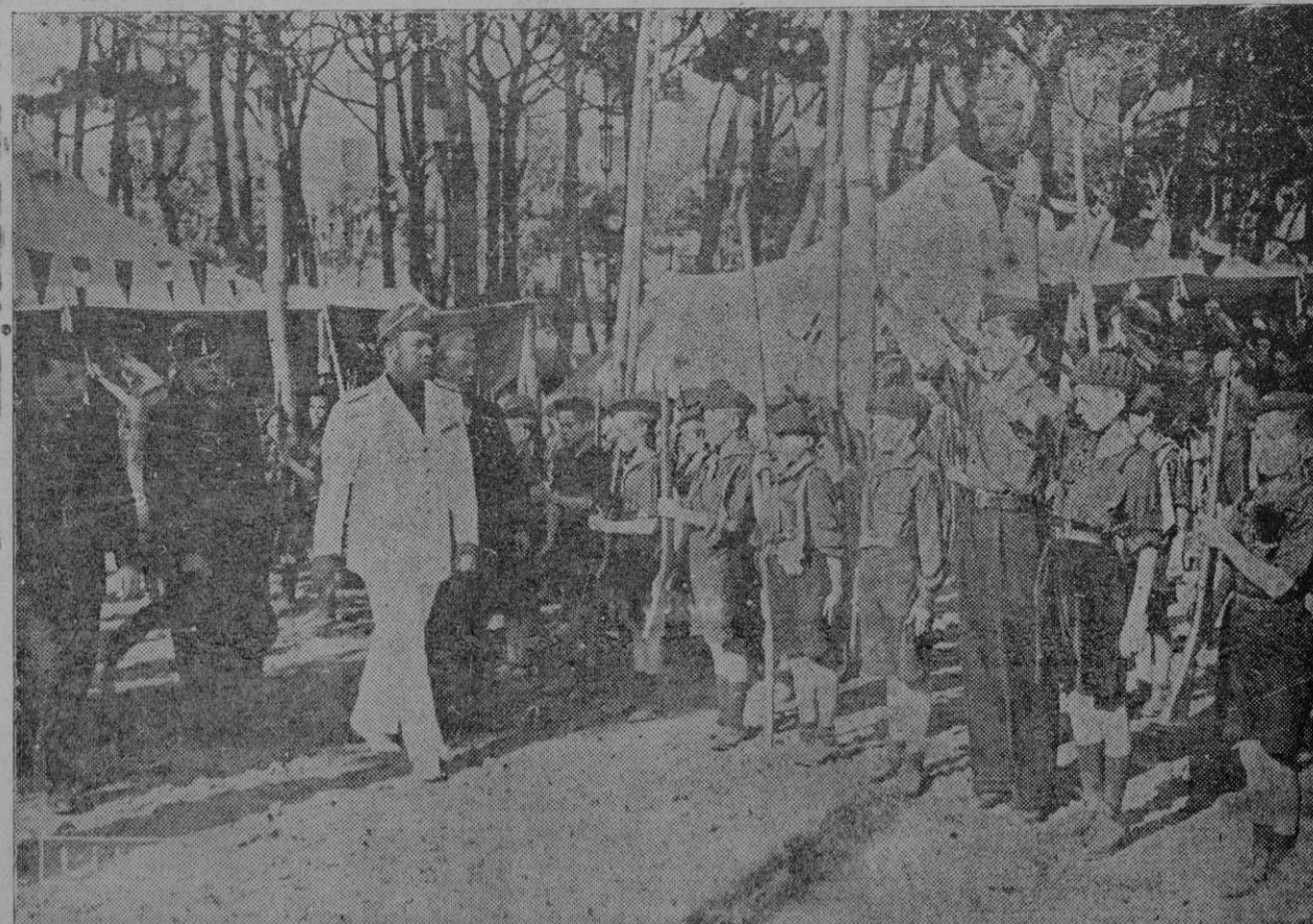
De la estancia de los niños españoles en Italia, donde tan afectuosamente fueron acogidos: Vista de S. E. el Ministro Conde Ciano al Campo España

Este cronista no quiere seguir la huella de su amigo. Ya se ha llevado muchas desilusiones en su vida y prefiere andar detrás de los sucesos, extrañado por ellos, ya que no se