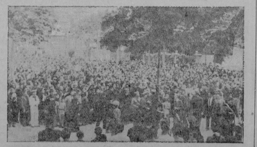
Un detalle de la manifestación celebrada anteaayer para protestar contra la agresión al acorazado "Deutschland" y de simpatía a Italia y Alemania

En los sectores de la Ciudad Universitaria y de la Casa de Campo el enemigo hizo algún fuego de cañón, que incendió algunos