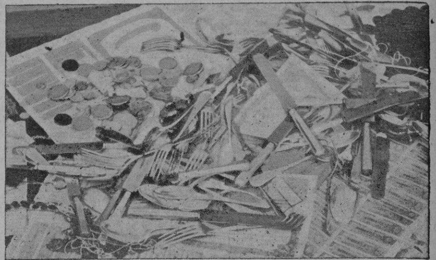
Así como a los dirigentes de la expedición contra Mallorca no les guiaba otro provecho que el de su renombre personal, así a los dirigidos les interesaba tan sólo la codicia del saqueo. Su botín de guerra eran relojes, dinero, cubiertos de plata y hasta títulos de la Deuda Amortizable. No tuvieron el valor del soldado para arrebatarles las armas al enemigo, ni la austeridad del comunista para resistir a las tentaciones del dinero.