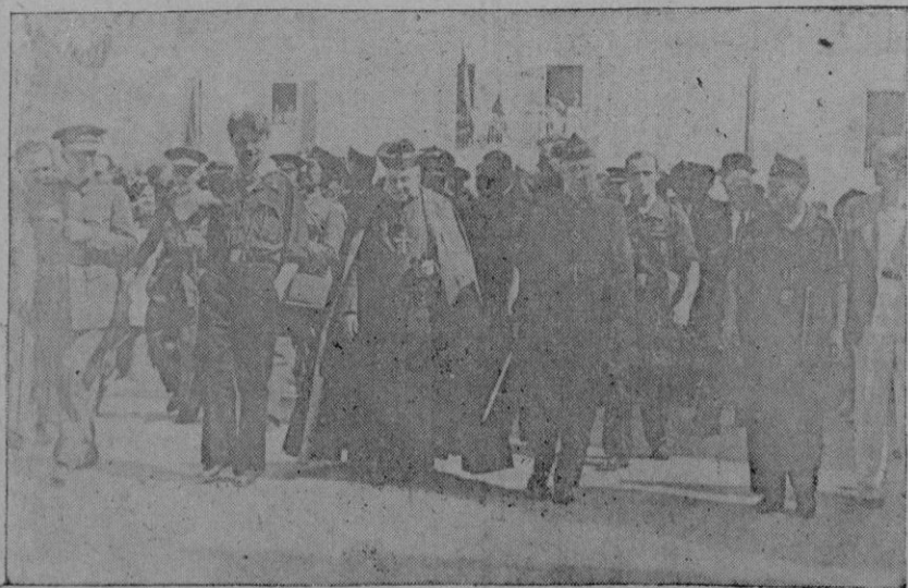
El Excmo. Sr. Arzobispo-Obispo con las demás autoridades y el Conde de Manacor, después de su salida de la iglesia parroquial.