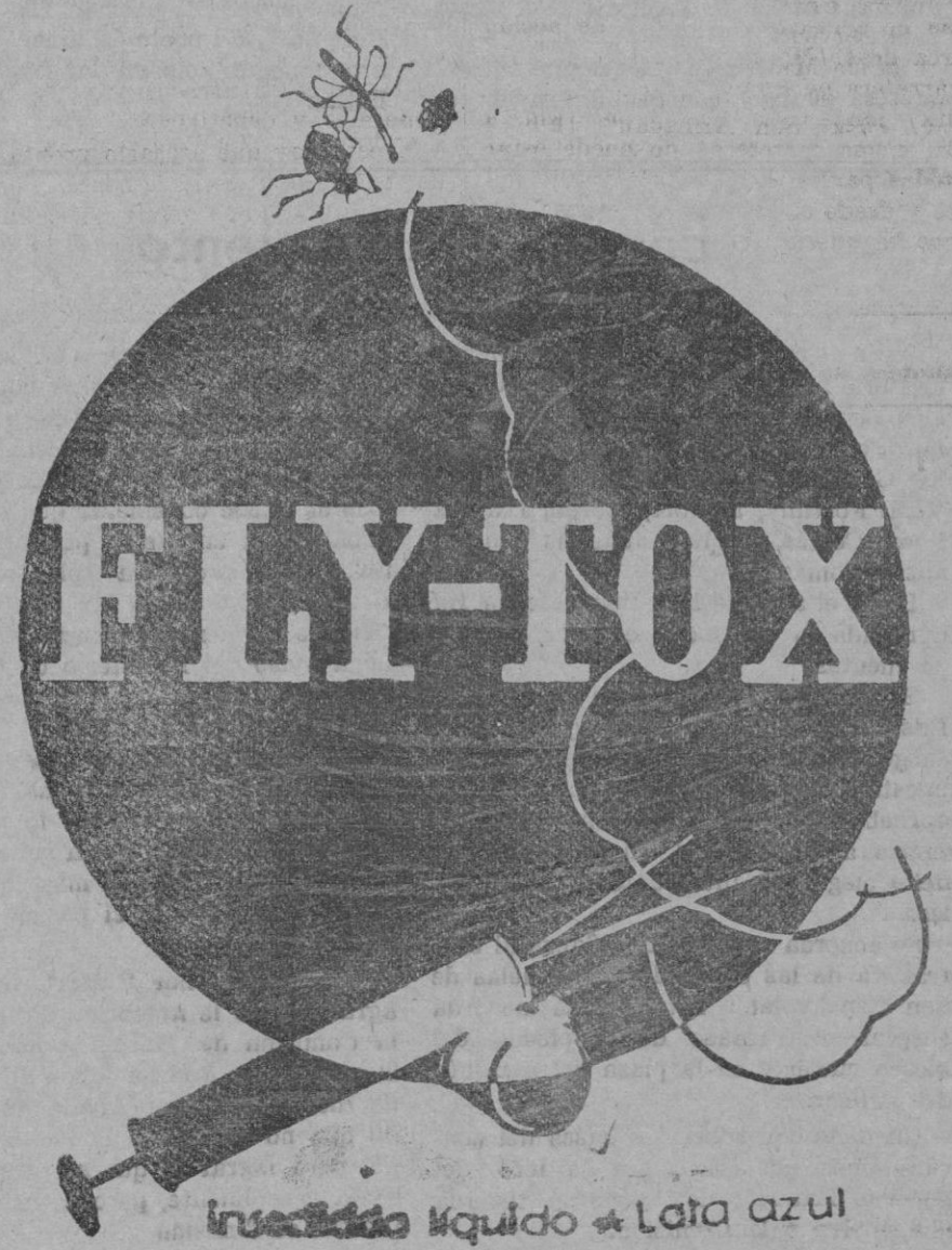
Insecticida líquido * Lata azul

Haga sus compras en los comercios que anuncian en «Correo de Mallorca»