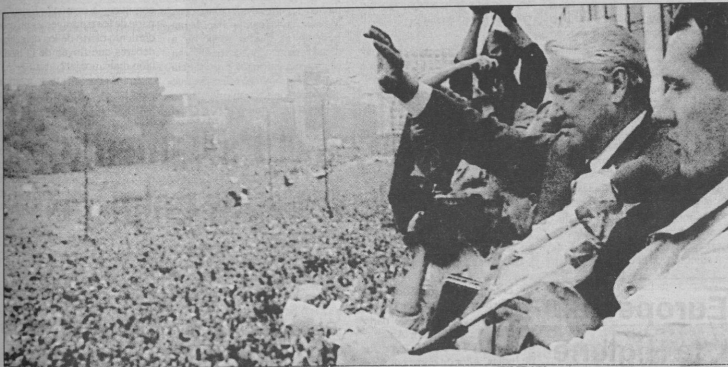
Boris Yeltsin saluda a la multitud de manifestantes que se concentró ayer ante el Parlamento ruso

Una multitud continúa concentrada en los alrededores del Parlamento ruso