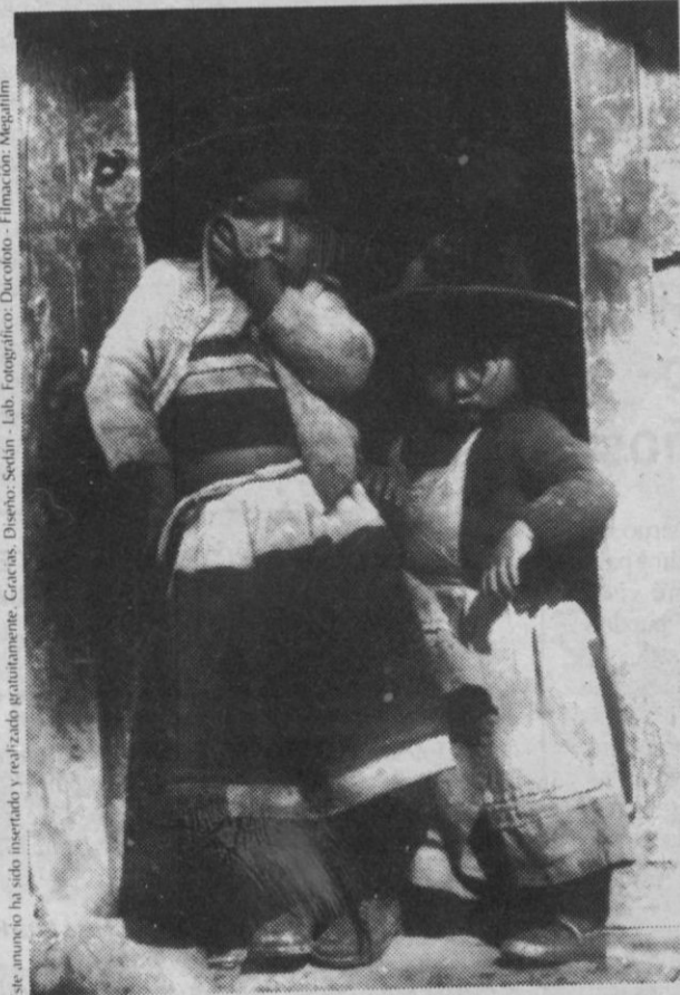
Este anuncio ha sido insertado y realizado gratuitamente. Gracías. Diseño: Sedán - Lab. Fotográfico: Ducrototo - Filmación: Megafilm

Ahora puedes ser padrino de un niño o de una niña con nombre y apellidos. Puedes salvar su vida y preparar su futuro con un estricto control de tu aportación. Pero él puede darte a tí mucho más que eso. Puede darte algo que el dinero no puede comprar. Haz la prueba. Ponte en contacto con nosotros. Déjate ayudar.