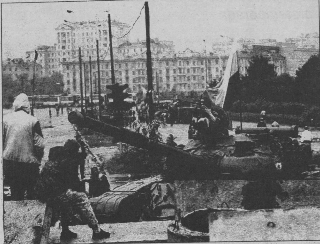
Seguidores de Yeltsin se agolpan ante los tanques

BELGICA. — La Comunidad Europea (CE) expresó ayer, martes, en La Haya "su grave preocupación por las frecuentes violaciones" del alto el fuego en Yugoslavia que "de nuevo ha traído como consecuencia graves pérdidas en vidas humanas".