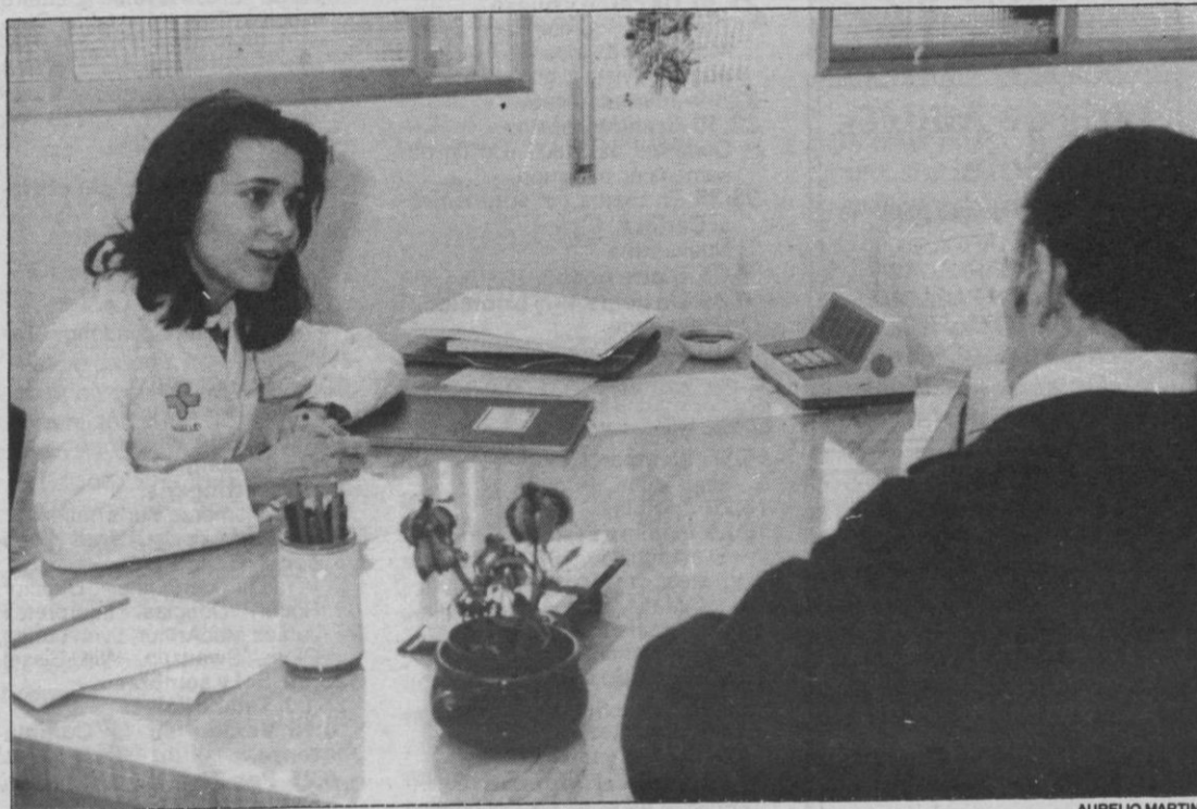
Segovia cuenta con 10 centros de salud para atención primaria

profilaxis obstétrica, salud mental y salud bucodental así como con un centro de orientación familiar.