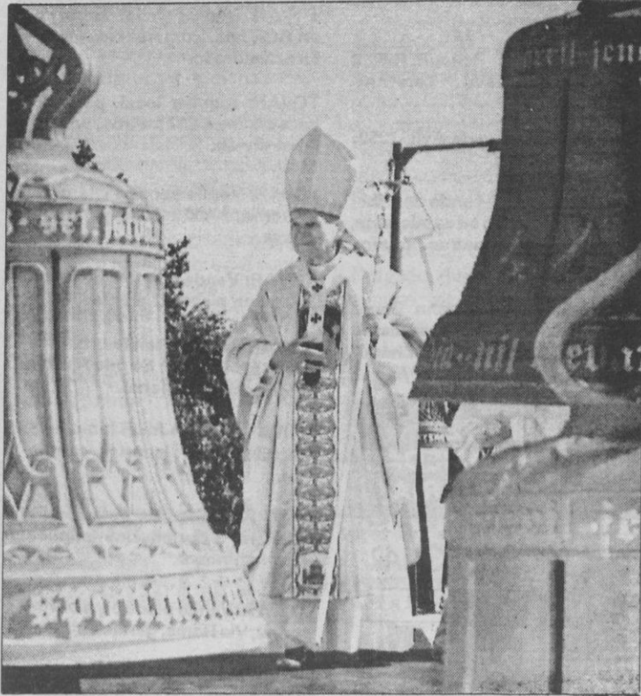
Juan Pablo II durante la misa que ofició ayer en la capital húngara

El Papa expresó ayer, en la plaza de los Héroes de Budapest, su apoyo a Gorbachov, y su deseo de que no cese el proceso de la "perestroika" por él iniciado.