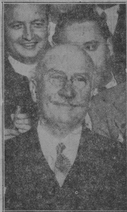
Don Alejandro Lerroux y Garcia, Jefe del nuevo Gobierno.