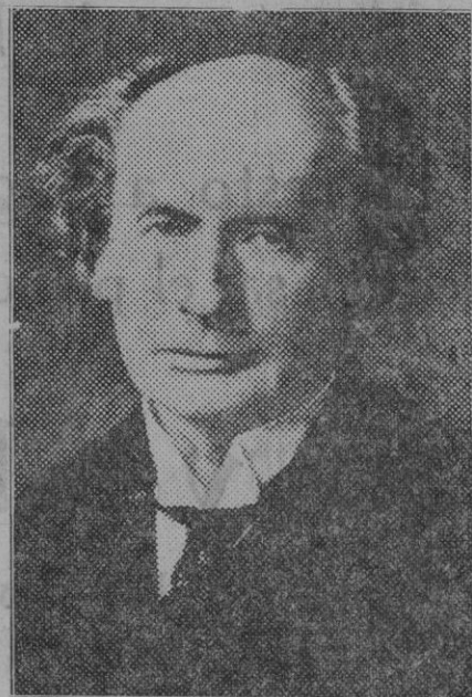
El gran compositor noruego Gerhardschjelderno, que ha fallecido en Alemania, donde residía desde hace muchos años.

Yo no sabía ocultar la impresión que creí se desprendía de la clara exposición de don Angel Herrera y la traduzco diciendo que fué para mí una impresión de cultura. No es lo suficientemente obscura esta palabra para permitir una divagación mediocre alrededor del eje de su contenido, y solamente señalaré dos características, hoy muy acusadas, y que indudablemente deben ser evaporadas y expulsadas de esta cultura en la que hay que sumergir a la juventud para que España, pueda el día de mañana presentar a la faz del mundo una vanguardia es-