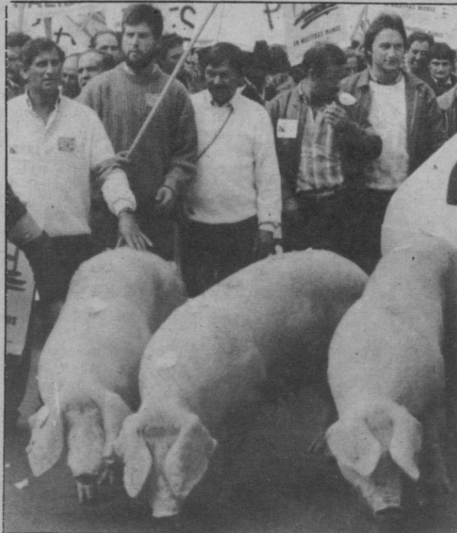
La grave crisis del porcino moviliza a los ganaderos

Ante esta circunstancia, que conoce muy bien la Administración autonómica pero que, en el mejor de los casos, parece des-