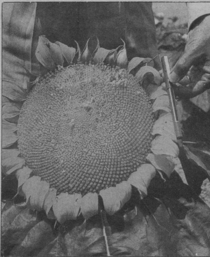
destacaría especialmente Euro-semillas.

La producción de semilla en España está controlada en este momento por un total de unas 20 firmas. De este número, las más importantes, menos de 10, con una gran participación de firmas multinacionales, se puede decir que controlan casi el 70 por ciento de todas las ventas en el país. Entre estas firmas con mayor peso estarían las Cargill, Bunge - Arlesa, Shell, Pacífico, Koipe, Agrar, Agro, etc... mientras que por parte de las que se podrían denominar firmas netamente españolas