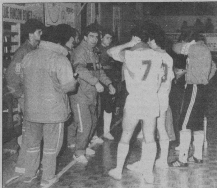
Dirigiendo a los jugadores

—Muy mal. Porque yo admiro que nos gane cualquier equipo,