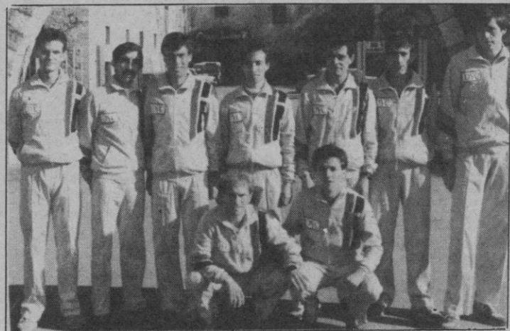
El Dyc, a mantener el título, aunque falte Esparcia

Por tierras de Zamora estuvieron el pasado fin de semana los atletas segovianos que compitieron en la tercera edición del Campeonato Autonómico de Campo a Través y Marcha.