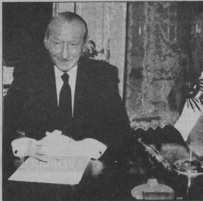
WALDHEIM REITERA SU DECISION DE NO DIMITIR

FREDERICK LOEWE, autor de obras musicales famosas como «My fair lady» falleció a la edad de 86 años en el «Desert Hospital» de Palm Spring en la madrugada del domingo.