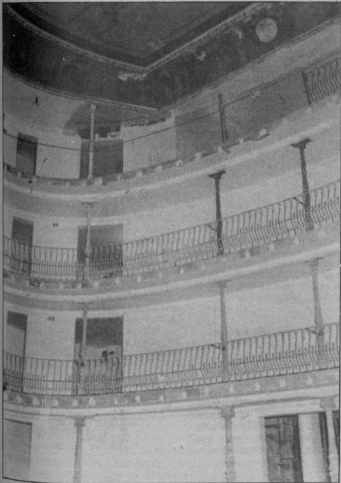
Aspecto del teatro Juan Bravo, con las obras de rehabilitación avanzadas, en septiembre de 1987.

Fuentes de la Diputación Provincial han señalado a este período que se trata de una paralización puntual, que se espera resolver en los próximos días, por dos aspectos concretos como son la falta de licencia de obras para la construcción de un transformador de electricidad y la firma de la escritura de la expropiación de una vivienda colindante.