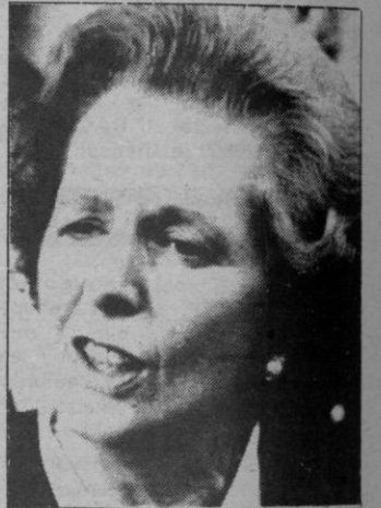
MARGARET THATCHER VENDRA A ESPAÑA EN NOVIEMBRE

tualidad, condiciones técnicas y de inversión con tres compañías internacionales de parques turísticos, porque tras la experiencia con Disney «nos hemos dado cuenta que somos un país codiciado por estas empresas y estoy seguro —dijo— que dará buen resultado». —Efe.