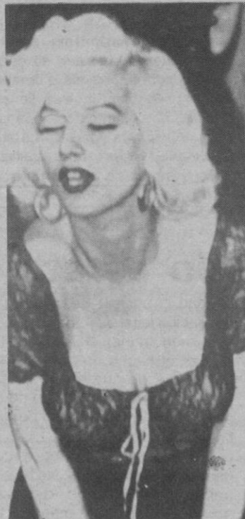
EL RECUERDO DE MARILYN MONROE

Ciudad del Vaticano.— El Papa Juan Pablo II ha designado al cardenal Angel Suquía Goicoechea, arzobispo de Madrid y presidente de la Conferencia Episcopal española, enviado especial al congreso eucarístico-mariano bolivariano, que tendrá lugar en Lima (Perú) del 7 al 15 de mayo; Juan Pablo II asistirá personalmente a su clausura.—Efe.