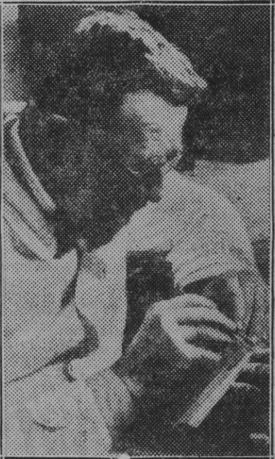
Berlin. — El profesor de antropología, doctor Eugen Fischer, nuevo rector de la Universidad de Berlin.

Este encuentro ha despertado mucho interés y dará comienzo a las cinco de la tarde.