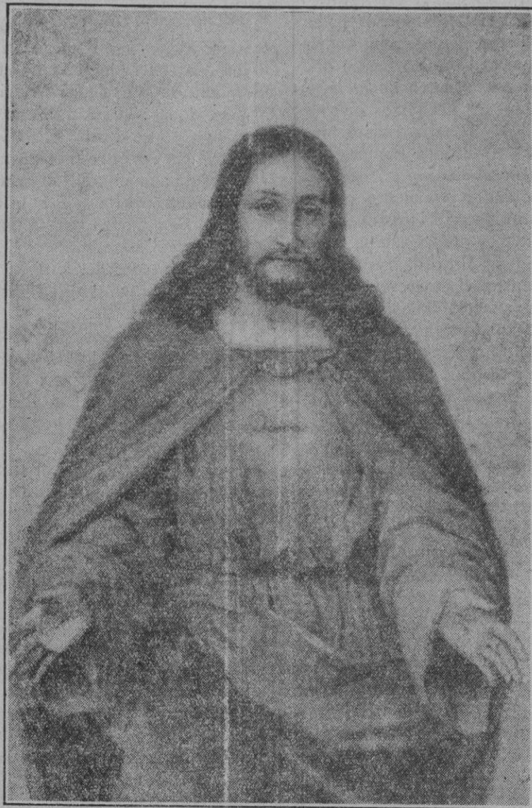
"...pidiendo esta fiesta, en especialidad para España, en que ni aun memoria hay de ella, me dijo Jesús: REINARÉ EN ESPAÑA Y CON MAYOR VENERACION QUE EN OTRAS PARTES".

Pero, por si alguien sospechara que esto es hablar por hablar, citaré un hecho que retrata admirablemente lo bien que estamos, un hecho que conozco perfectamente porque lo estoy viendo de cerca en la región donde vivo. Es posible que este año vuelva a haber en Castilla una buena cosecha. Y son muchos los labradores que temen esta ventura; ¿Por derrotistas? ¿Por enemigos del régimen? No; por nada de eso. Temen una buena cosecha porque, si ahora no pueden vender más que a precios ruinosos y aún así con dificultad los productos de la tierra que será de ellos si luego de tener que pagar gastos exorbitantes por la recolección sin contar el aumento de contribuciones y gabelas de mil clases, se encuentran con que la cosecha no tiene salida ni regada. ¿Y este no es temor de los grandes terratenientes, que bien apabullados están a estas alturas, sino de los labradores pequeños y medianos, que pudieran y deberían ser el cogollo de la agricultura española y llevan trazas de quedarse en subproletarios de peor condición que los jornaleros.