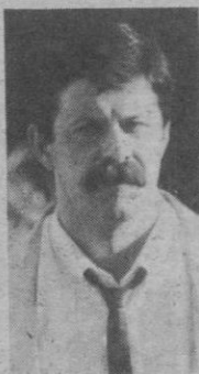
Natural de Cantalejo (Segovia). Alcalde de Cantalejo desde 1979 y Diputado Provincial.