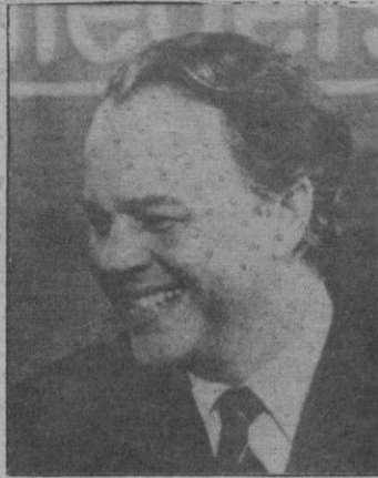
El primer ministro de Baja Sajonia, el democristiano Ernst Albrecht.

La mayor sorpresa la dieron los «verdes», que no pudieron capitalizar la preocupación del electorado con las centrales atómicas de Chernobil y sólo llegaron al 7,1 por ciento, un 0,6 más que en 1982, pese a que algunos