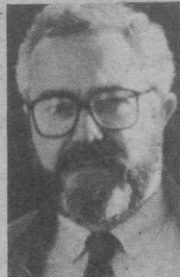
Natural de Segovia. Funcionario de Correos. Procurador en las Cortes de Castilla y León y Diputado Provincial. Ex-Secretario General de la U.G.T. de Segovia.