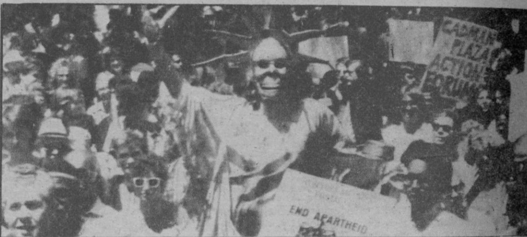
Miles de manifestantes protestaron en el Central Park de Nueva York por la situación que vive Suráfrica.

Después, el presunto agresor golpeó la cabeza del pequeño Antonio contra el muro que cierra el patio del colegio.