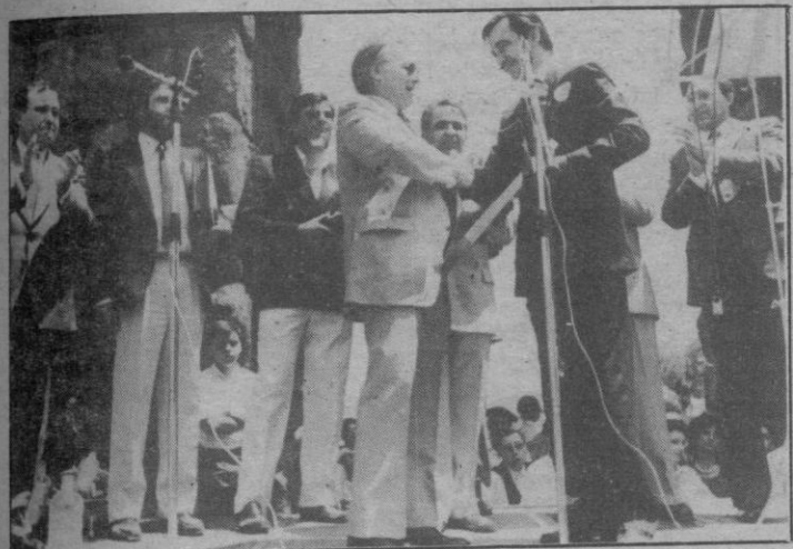
El presidente del Centro Segoviano de Madrid (a la derecha en la fotografía) entrega al presidente del CIT, la placa conmemorativa.

Terminado el almuerzo, los excursionistas procedentes de otras capitales se trasladaron al Real Sitio de La Granja para visitar los jardines.