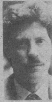
Natural de Segovia. Médico radiólogo. Alcalde de Segovia y Senador por el PSOE en la anterior legislatura.