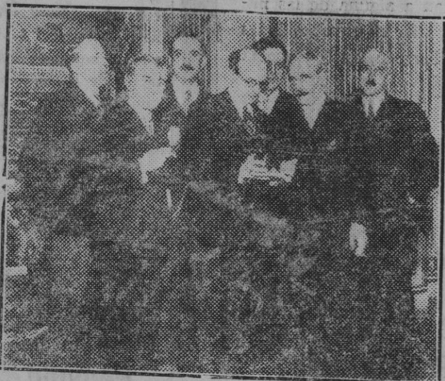
PARIS. — En la embajada de España. El embajador español señor Madariga, imponiendo al poeta y académico francés M. Paul Valéry, la Cruz de Isabel la Católica, que le ha sido otorgada por el Gobierno francés.

Esta tarde a las siete y media, el mismo orador en el mismo local y sobre el mismo tema, dará una segunda conferencia.