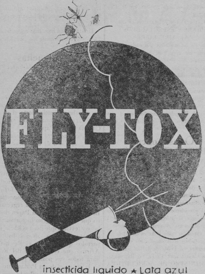
insecticida líquido ★ Lata azul

Se admiten esquelas mortuorias hasta las once de la mañana.