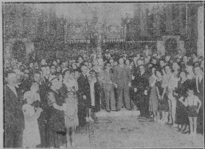
Barcelona. — Recepción celebrada en el Salón de Ciento del Ayuntamiento en honor d los alumnos extranjeros de la Escuela de Verano, con motivo de su Semana Final.

No quiero consignar nada más; sus méritos y virtudes eran acreedores a mejor pluma, más con lo hasta aquí apun-