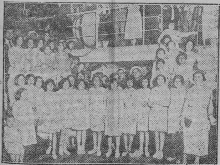
Barcelona. — Niñas barcelonesas que constituyen la colonia escolar enviada a Mallorca por el Ayuntamiento de Barcelona a bordo del "Ciudad de Barcelona", en el que hicieron el viaje a la isla.

Los "Trescadors" asistirán de uniforme y con su banda.