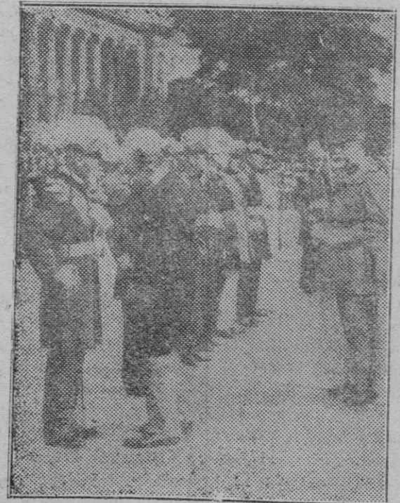
París. — El Presidente de la República, M. Lebrun, impone la Medalla Militar al almirante Le Bris, después de la revista militar celebrada ante el Petit Palais para conmemorar la Fiesta Nacional francesa.