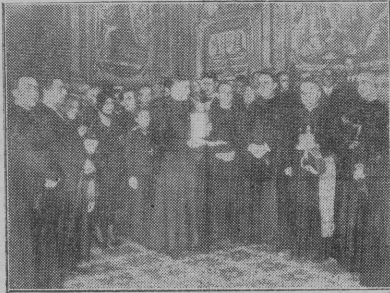
Barcelona. — El obispo de la diócesis Doctor Irurita, durante el homenaje que le tributaron los periodistas católicos en el Palacio Episcopal.

límites de la Cataluña estricta, como una etapa de la realización de nuestro ideal de extensión patriótica.