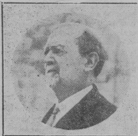
El conde de Bugallá, ex presidente del Consejo que ha fallecido en París.

Después de esto ¿quién no se explicará la resistencia que oponen y el miedo que sienten la mayoría de los actuales diputados a la disolución de las Cortes? Saben lo que les espera. Les espera, si luchan, que muchos ni lucharán siquiera, la derrota, que es la pérdida de la influencia y del favor, y la no despreciable para el mayor número, del estipendio que perciben. Y ante eso, quisieran que las Cortes, convocadas para hacer y votar una Constitución, murieran, si morían alguna vez, de puro viejas. No lo conseguirán. El fruto ha venido a madurez y cuando el fruto maduro no se retira por la mano del cultivador, él mismo se desprende y cae al suelo, podrido. Lo que está sucediendo fuera de las Cortes hará buena esta alegoría. — PATRICIO.