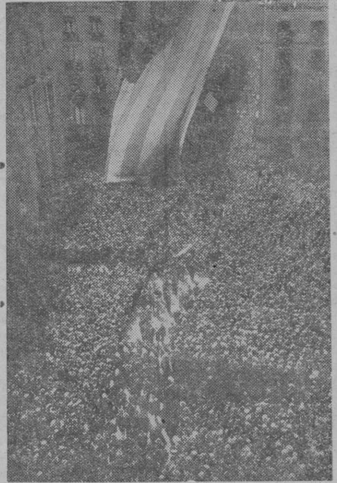
Barcelona. — Manifestación pro Estatuto integral de Cataluña. — Imponente aspecto que ofrecía la plaza de la República.

LA FILADORA SASTRERIA Y CAMISERIA A MEDIDA. Extenso surtido en ropas hechas.