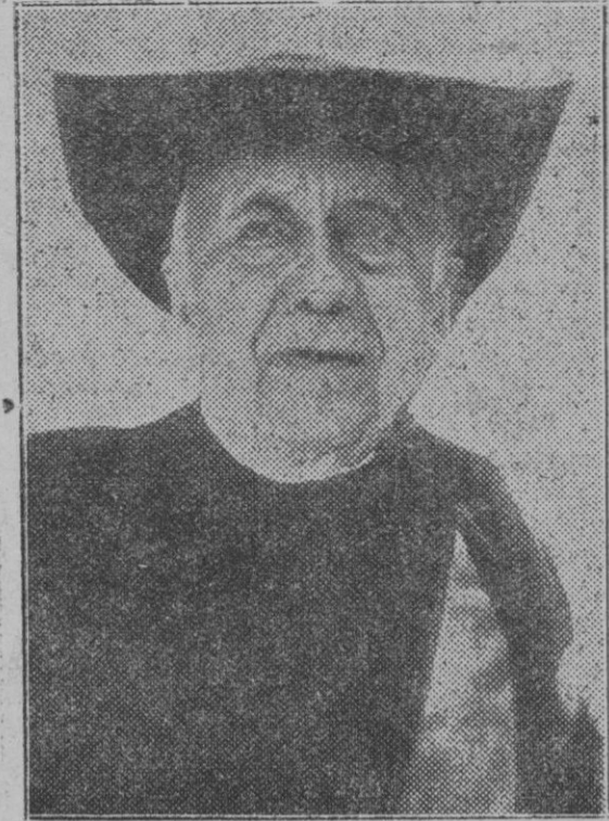
Mosén Jaime Collell, canónigo de Vich y eminente poeta y publicista catalán, que ha fallecido en dicha ciudad.

Y si no es así le invito a Vd. a documentarse por segunda vez y a citarme en cuál de sus escritos dicen tales cosas. Vamos, que es muy cómodo eso de colgar a quien no puede defenderse un sambenito como este.