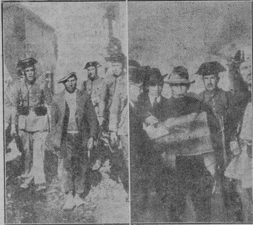
De los bárbaros asesinatos de Castilblanco: Cabezillas del motín, al ser conducidos por la Guardia civil al Ayuntamiento de Castilblanco.

El señor Alcalde, los diputados, tenientes de alcalde y concejales procedieron al reparto de juguetes. Fue