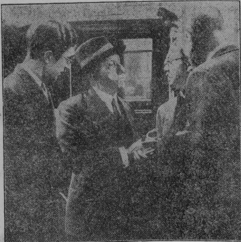
Madrid. — El ex ministro, general Aizpuru, al salir del Congreso después de prestar declaración ante la Comisión de Responsabilidades.