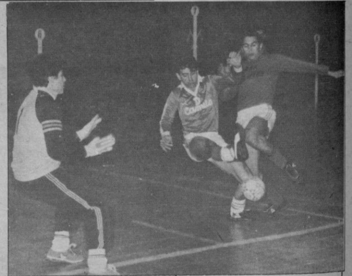
Los «peques» se salen. Todo un buen récord de once goles en su haber. Por eso son líderes.