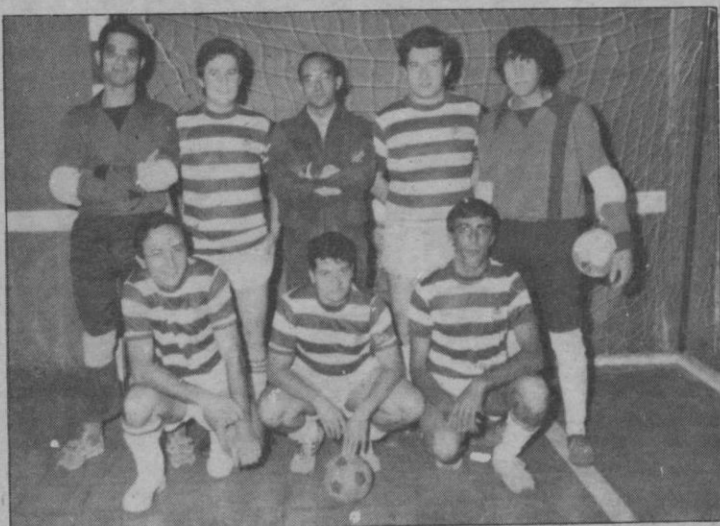
Caja Nava: Continúan puntuando