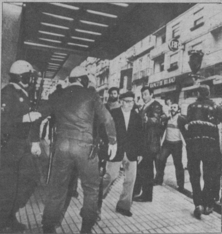
Vigo. — Un transeúnte pasa entre policías y manifestantes al iniciarse la carga para desalojar a los trabajadores de Ascón de las proximidades de unos grandes almacenes.

El Comité Intercentros de Renfe ha convocado un paro de dos horas de duración para el próximo día 7, en el que no se van a respetar los servicios mínimos, en el caso de que sean establecidos. El motivo de la huelga es el cierre de líneas férreas deficitarias a partir del próximo 1 de enero, tal como aprobó el Consejo de Ministros el 30 de septiembre.