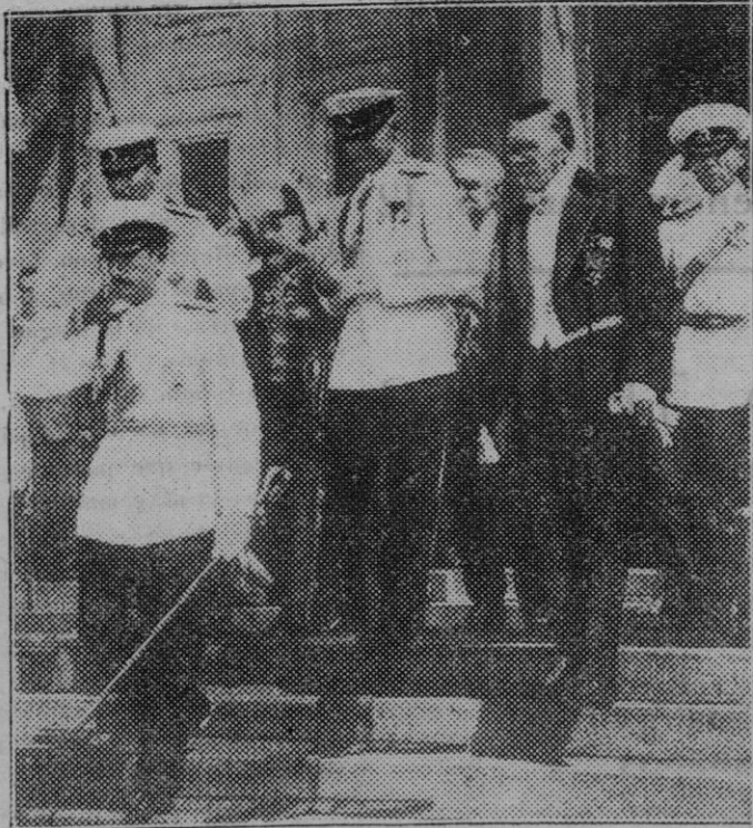
Safia. — El Rey Boris al salir con su séquito del Palacio de las Cortes, después de la apertura del Parlamento búlgaro.

El darrer any de la meva carrera, me vaig cuidar, ab els condeixebles, del "Ca-