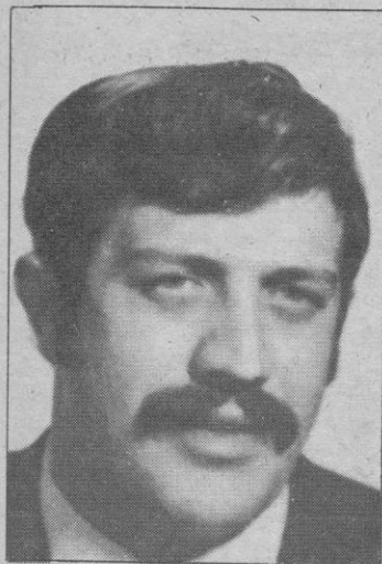
Presidente del Arévalo e Hijos: «Volveríamos a participar en un torneo de esa índole, pero haciendo las cosas con un poco más de seriedad»

Nuestra misión, la de este periódico, es informar. Cuando deseamos dar nuestra opinión lo hacemos de forma que no se confundan los términos. Valgan estas frases para iniciar la exposición de un tema que viene siendo conflictivo desde que se celebrara el torneo cuadrangular que disputaron cuatro equipos segovianos de fútbol. En esta ocasión hemos querido recoger la versión que nos proporcionaban los presidentes de dos de los clubs participantes. El tema tiene, pues, una consideración directa sobre una situación de la que se habla en los medios deportivos de nuestra ciudad.