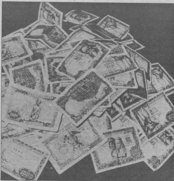
El tema es... cuestión de dinero

Quizás el «meollo» de la cuestión esté en las cuentas. Parece que no cuadran.