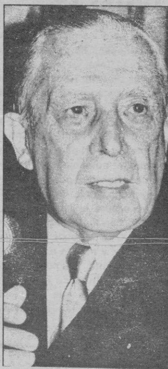
El filósofo Xavier Zubiri murió ayer, a los 84 años, víctima de un carcinoma

intestinal que padecía desde hace cuatro años. Ayer sufrió una hemorragia interna, por lo que fue trasladado con urgencia a la clínica de la Concepción, de Madrid, donde ingresó cadáver a las siete de la tarde.