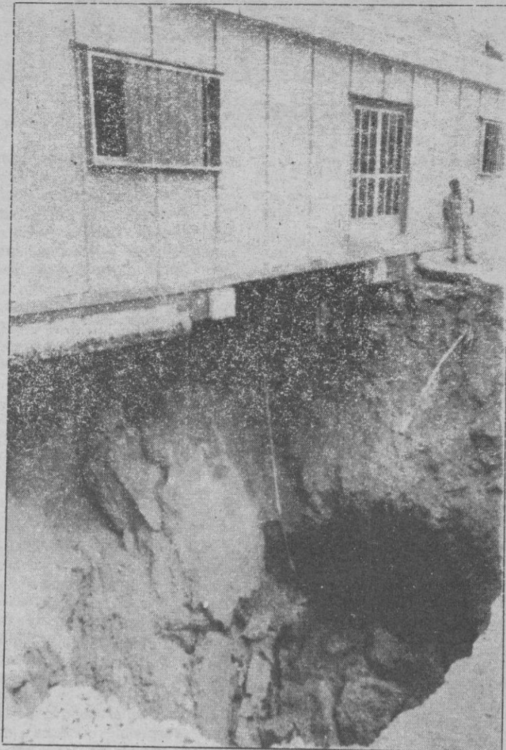
Los vecinos de San Millán recuerdan con preocupación momentos como los del 6 y 7 de agosto de 1981

Otro tema que la Asociación no está dispuesta a dejar pasar sin solución es el del colector del Clamores. «Tal como está ahora mismo la instalación —nos dice el presidente— en cuanto haya