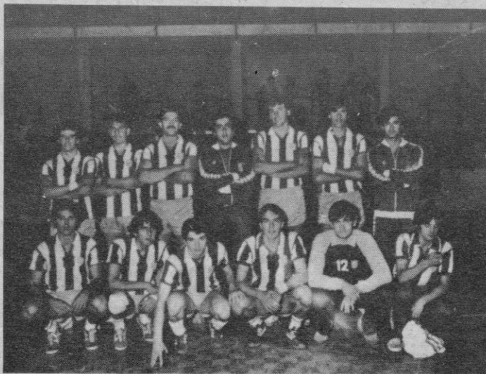
EL AT. MADRID EN NAVA DE LA ASUNCION

El próximo domingo, a las 12, y dentro de las fiestas de Nava de la Asunción, se juega un encuentro amistoso de balonmano que van a disputar el equi-