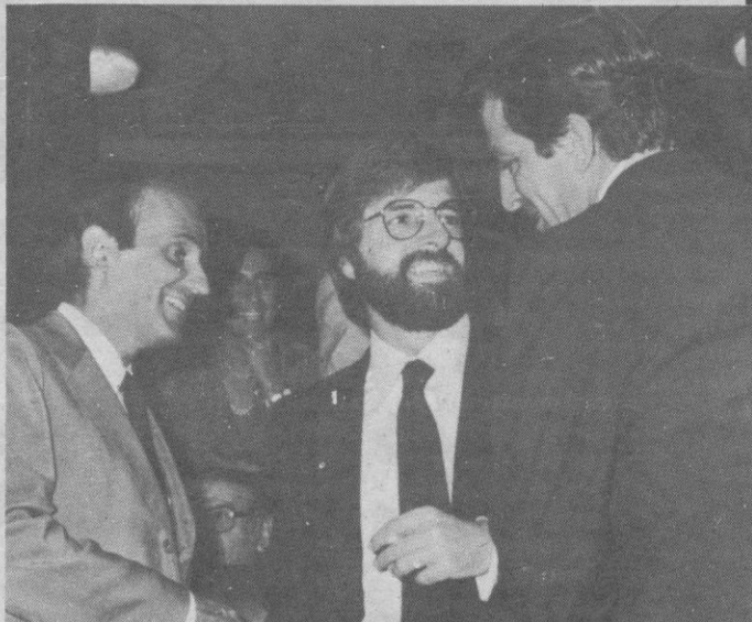
Madrid.—Con la intervención de los portavoces de los diferentes grupos parlamentarios, a excepción del Popular, cuyo líder, Manuel Fraga, habló el martes, ayer tarde se reanudó el debate sobre política general en el Congreso. En la foto, los diputados Miguel Roca, Marcos Vizcaya y Adolfo Suárez conversan en el hemisiclio del Palacio del Congreso poco antes de iniciarse la sesión de ayer tarde.

En una llamada al diario local «Los Sitios», una voz de hombre que decía hablar en nombre de la organización terrorista «Terra Lliure», se ha responsabilizado de la acción y ha añadido que se había realizado como protesta por el discurso del presidente del Gobierno en el Congreso y «el menosprecio hacia las autonomías del señor Guerra». —Efe.