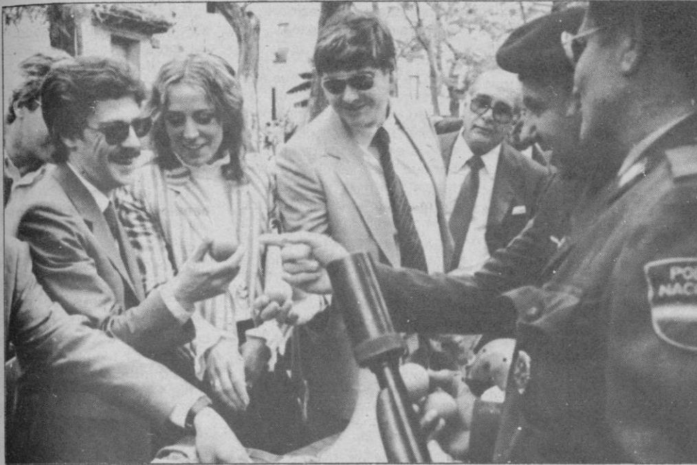
El sábado tuvo lugar en la plaza de Colmenares una exhibición de material con los que cuenta nuestra provincia para la Protección Civil y la Seguridad Ciudadana en caso de emergencia. En la fotografía, mandos de la Policía Nacional, explican a las primeras autoridades el material por ellos expuesto. (Pág. 5)

El miércoles, a las 12, se constituye la Diputación Provincial