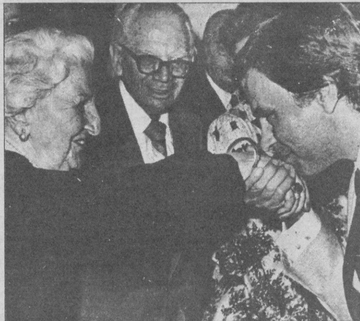
A su llegada a Méjico, el presidente González saludó, entre otros destacados españoles residentes allí, a doña Dolores Rivas Cherif, viuda del que fuera presidente de la II República, Manuel Azaña.

«Miguel Roca —explicó el dirigente liberal— pretende crear una opción política sobre una casa, Convergencia i Unió, que se le cae encima. Cuando su fracaso deje de ser un hecho probable para convertirse en cierto, Miguel Roca y la propia Convergencia i Unió se integrarán en la Coalición Popular.»