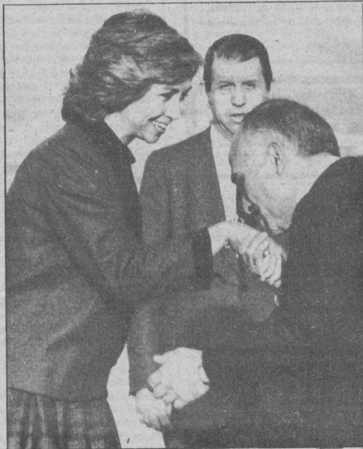
Madrid.— El Rey Hussein de Jordania y su esposa, la princesa Nour, llegaron ayer tarde a Madrid en visita de carácter privado de 19 horas de duración, con el fin de visitar al Rey don Juan Carlos, que se recupera de la lesión de pelvis. Los monarcas hachemitas fueron recibidos en el aeropuerto de Barajas por la Reina doña Sofía y el presidente del Gobierno Felipe González. En la foto, el Rey Hussein de Jordania saludando a doña Sofía, poco después de descender del avión que él mismo pilotó hasta Barajas.

tablece la excomunión: herejía, apostasía, cisma, aborto provocado, sacrilegio contra las Sagradas Especies, violencia física al Sumo Pontífice, ilícita absolución de los pecados, consagración abusiva de un obispo, violación del sigilo sacramental.