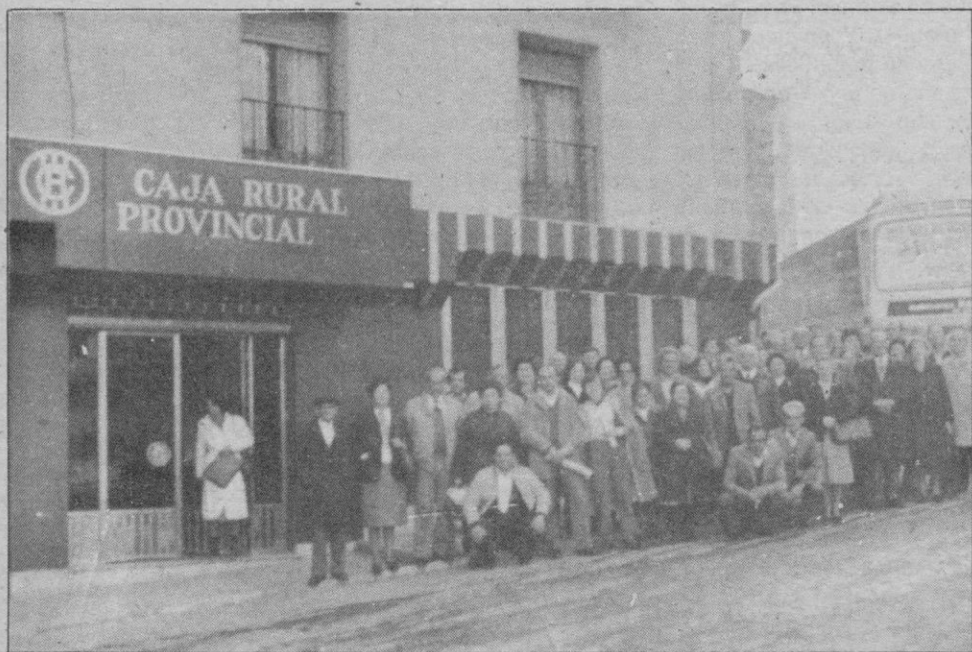
En el día de ayer salió la expedición del 2.º turno compuesta por 50 personas que durante diez días permanecerán descansando en la Residencia Campomar situada en Guardamar del Segura (Alicante), invitados por la CAJA RURAL PROVINCIAL de acuerdo con el sorteo realizado entre sus socios y colaboradores. En la fotografía, un momento de la salida.