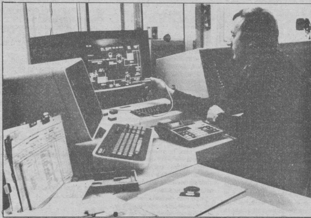
Essen.— La industria «Krupp Atlas-Elektronik», de Bremen (República Federal de Alemania), ha creado un nuevo sistema electrónico para el control a distancia de las redes de suministro de corriente eléctrica, gas agua y calefacción y que se de-