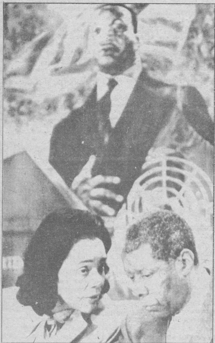
ATLANTA.—Coretta Scott King, viuda de Martín Lutero King, intercambia unas palabras con Jesse Hill, durante una conferencia de prensa celebrada en el Centro Martín Lutero King, en Atlanta.

EL PARLAMENTO EUROPEO pidió «urgentemente» al Consejo de Ministros y a la comisión de la Comunidad Económica Europea (CEE) la reanudación de las negociaciones pesqueras con terceros países, entre ellos España.