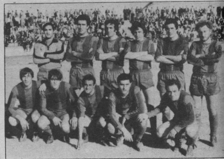
G. Segoviana: Fue la última formación en la pasada temporada ¿Cuántos quedarán?

Aunque no existen fechas concretas, pudiera ser que en los últimos días de este mes de julio la G. Segoviana llevará a efecto su presentación oficial. Se haría en La Albuera y frente