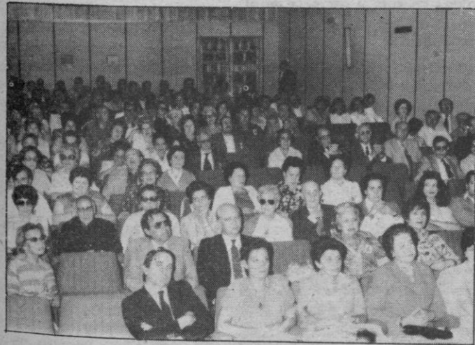
Parte del público que asistió al acto