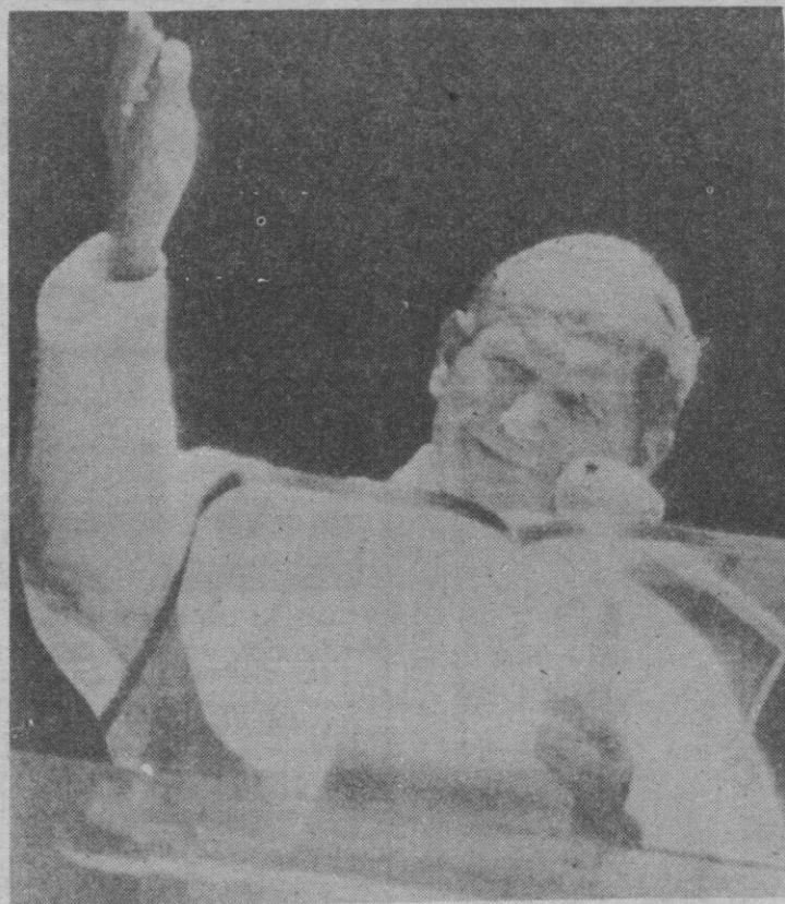
EL PAPA SALUDA AL MUNDIAL-82

Méjico.— Miguel de la Madrid Hurtado, candidato del Partido Revolucionario Institucional en las Elecciones presidenciales de Méjico, resultó vencedor en los comicios celebrados ayer en el país. El secretario de Gobernación y presidente de la Comisión Federal Electoral, Enrique Olivares Santana, ha afirmado que, aunque no se iban a ofrecer datos concretos del recuento de votos, se podía asegurar que el PRI aventajaba abrumadoramente al resto de los partidos que habían presentado candidatos en las elecciones.— Efe.