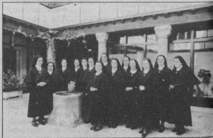
La comunidad de Siervas de María

— Entonces sentía mucha ilusión por cuidar a los enfermos y entregarme al Señor. Aquello resultó bastante difícil y sobre todo un enorme sacrificio al