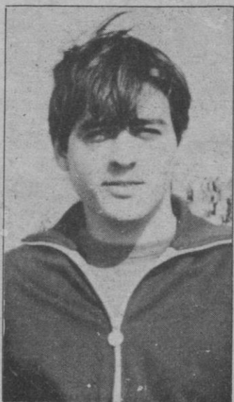
Artero: Un delantero en su sitio

apreciación, botó dentro, pero el árbitro estaba muy lejos y el linier mando seguir el juego. Mientras, los delanteros gimnásticos, rondaban con buen juego, el área visitante, donde Ubeda demostraba una gran categoría de portero, parando casi todo. Durante 45 minutos pudimos ver este espectáculo y pensar lo bonito que es el fútbol sin tácticas defensivas. El G. Alcazar demostró ser uno de los mejores equipos que han pasado esta temporada por Segovia, mientras que los locales respondieron a ese juego con un afán de victoria e intentando demostrar que han ascendido por méritos propios.