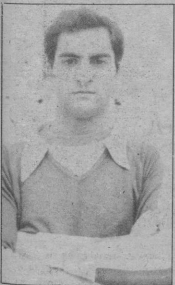
Buquerín: Lo paró «casi» todo

Qué bonito es el fútbol cuando en él no influye excesivamente la obligación de ganar los puntos. Qué bonito es, repito, cuando las necesidades no imponen a los entrenadores el coartar la «libertad» en el juego de sus hombres, situándoles en demarcaciones férreas que no les permiten excesivas alegrías. Porque en los primeros minutos de partido, realizando ambos equipos un juego alegre, rápido y con visión de gol, pudieron conseguirse tantos que a nadie hubiera extrañado que subieran al marcador. Borreguero, a portero batido, sacó un balón con la cabeza bajo los palos; seguidamente Asterio mandaría el balón al larguero, y en su caída el balón, según nuestra