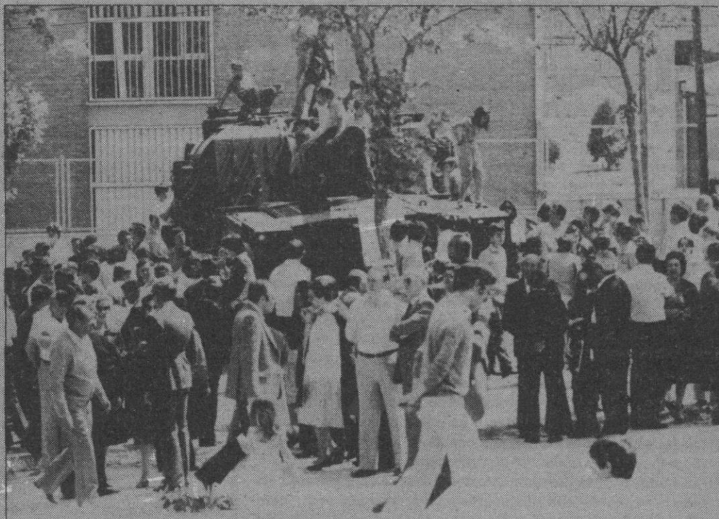
En La Dehesa se celebró ayer la «Jornada de puertas abiertas», organizada con motivo del próximo «Día de las Fuerzas Armadas». Asistieron cientos de personas y resultó de gran brillantez.