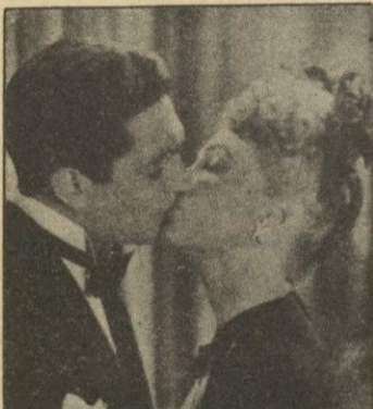
Una romántica escena entre Robert Alda y Joan Leslie.

La vida del pequeño George Gershwin, hasta entonces un niño como tantos otros, va a co-