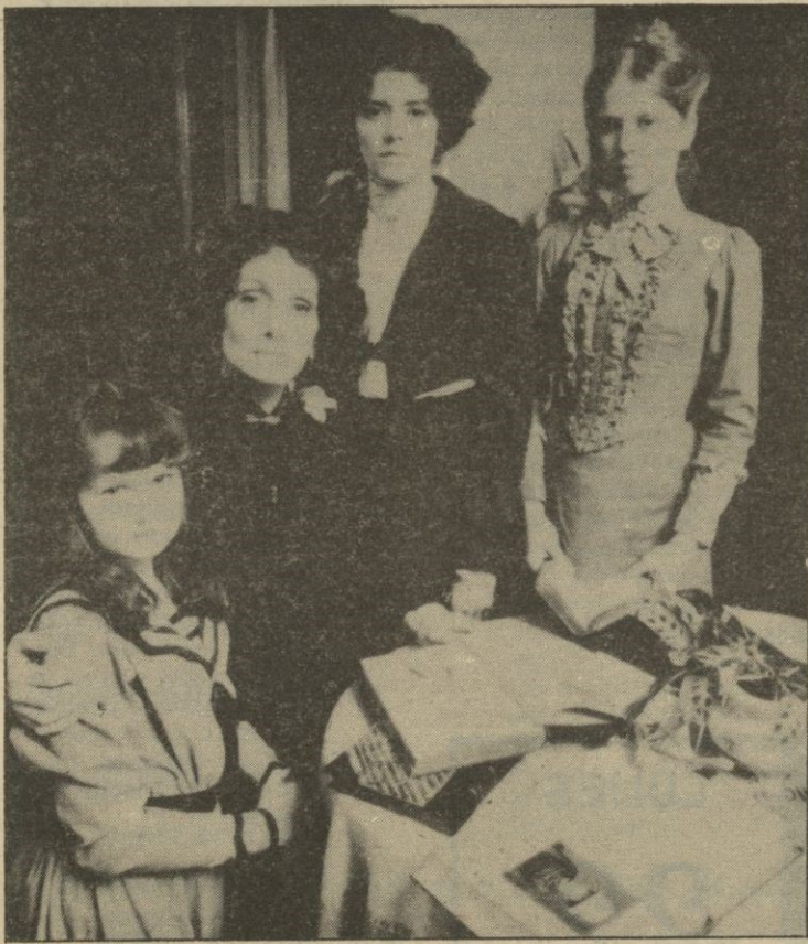
«Hombro con hombro». De izquierda a derecha: Louise Plank, Sian Phillips, Patricia Quinn y Angela Down.

La familia se traslada a una casa más pequeña, para reducir gastos. La señora Pankhurst trabaja en una tienda de objetos de arte y Silvia continúa estudiando con una beca. Por su parte, Christabel ayuda a su