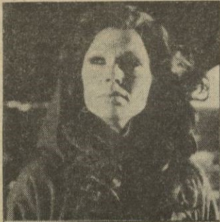
Pamela Salem, una de las protagonistas de la nueva serie.

Después de un viaje sin incidencias a través del