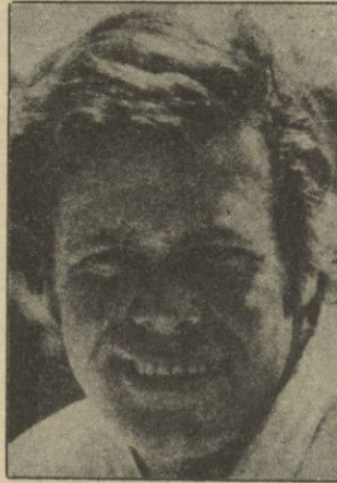
Doug McClure hace el papel de un piloto de helicóptero.

En un avión de una compañía aérea de vuelos charters se produce en vuelo una grave intoxicación provocada por algu-